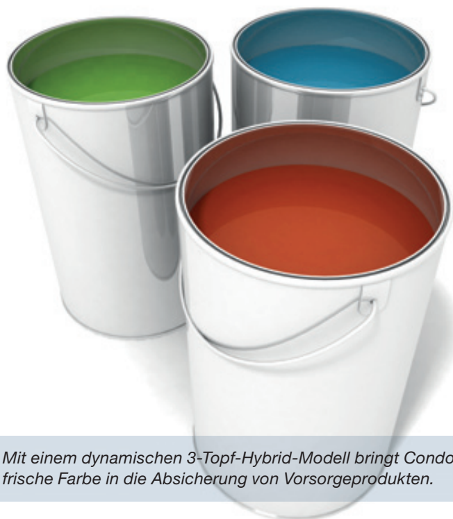
Mit einem dynamischen 3-Topf-Hybrid-Modell bringt Condor frische Farbe in die Absicherung von Vorsorgeprodukten.

Mit der fondsgebundenen Riester-Rente „Congenial riester garant“ führt Condor die Pluspunkte variable Garantie und attraktives Renditepotenzial in einem Produkt zusammen. Mit der neuen Förder-Rente bedient man nunmehr im Rahmen der Produktgruppe „Congenial mit Garantie“ alle Segmente der Altersvorsorge. Im Vertrieb ist die Riester-Rente seit Juni. Dank seinem dynamischen Wertsicherungskonzept kann das Produkt zur neuen, besonders verbraucherfreundlichen Riester-Generation gezählt werden.