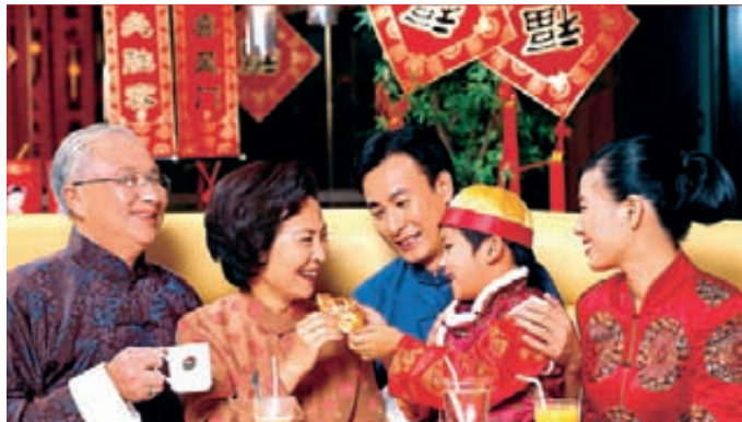
Fastfood-Riese Yum! Brands: Jährlich 400 neue Filialen in China.

Das Feld ist heterogen, sogar innerhalb eines Landes. In China beispielsweise besitzen über 95 Prozent der Stadtbewohner einen Kühlschrank, auf dem Land nur jeder vierte Einwohner. Gerade diese Diskrepanz macht den Trend der Landflucht unter Konsumaspekten so interessant. So kauft der ehemals ländliche Selbstversorger nunmehr im städtischen Supermarkt ein und stellt die erworbenen Waren zu Hause in den besagten Kühlschrank – oder er geht gleich ins Restaurant. Wie auch immer: Er konsumiert. Und der Trend zur Urbanisierung schreitet voran. Derzeit leben etwa 50 Prozent der Weltbevölkerung in Städten, die UNO schätzt, dass es 2030 rund 60 Prozent und 2050 bereits 70 Prozent sein werden.