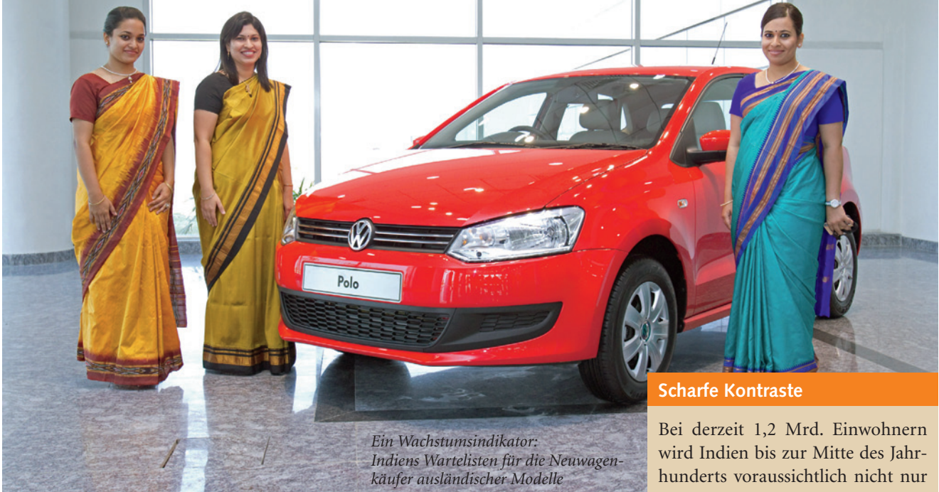
Ein Wachstumsindikator: Indiens Wartelisten für die Neuwagen- käufer ausländischer Modelle

Warum haben Sie 1996 nicht in Indien angelegt? Mit einem Fonds, z.B. der deutschen Kapitalanlagesgesellschaft DWS, hätten Sie dann schon in 2006 einen schönen Wertzuwachs von 648 Prozent verzeichnen können. Sogar 1.387 Prozent wären mit dem Fonds der englischen Gesellschaft HSBC drin gewesen. Leider hat Ihnen damals niemand erzählt, dass man überhaupt in Indien sowie in anderen „Entwicklungsländern“ Geld anlegen kann.