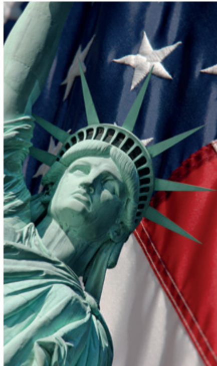
Eine ausgewogene Depot-Diversifikation kommt ohne die immer noch größte Volkswirtschaft der Welt nicht aus. Aber: welchen ETF dafür wählen?

Dieser Index bildet die Performance des S&P 500 auf Tagesbasis genau umgekehrt ab (inverses Verhalten). Das zugehörige db x-tracker ETF-Produkt eignet sich ausdrücklich nicht für den langfristig orientierten Anleger und stellt definitiv nur ein taktisches Instrument dar, dessen Einsatz aufgrund einer speziellen Marktmeinung mithilfe aktiver Informationsbeschaffung zeitlich begrenzt sein sollte.