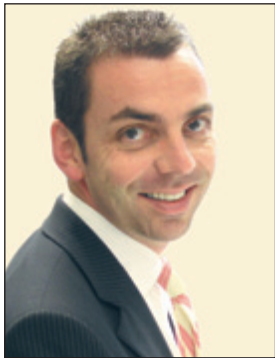
Autor: Hans-Joachim Reich

Die Verfolger holen mit großen Schritten auf, dennoch sind die USA nach wie vor die mit Abstand größte Volkswirtschaft der Welt. Für ein global ausgerichtetes Investmentportfolio ist die Berücksichtigung des amerikanischen (Aktien-) Marktes damit von wichtiger, strategischer Bedeutung. Insbesondere an den Finanzmärkten wird der Taktstock immer noch ganz wesentlich von den USA geschwungen.