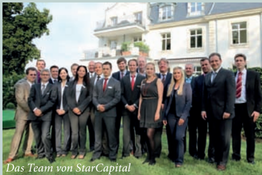
Das Team von StarCapital

Die StarCapital AG wurde im Jahr 1996 gegründet und bietet ihren Kunden mit ihren Fonds ein ganzheitliches Vermögensmanagement. Als 100%ige Tochter der Huber Portfolio AG haben wir unseren Firmensitz in Oberursel. Mit unserer Tochter, der StarCapital S.A. in Luxemburg und dem Kooperationspartner StarCapital Swiss AG in