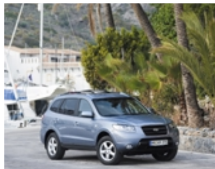
■ Korea bedient die ASEAN-Staaten im innerasiatischen Handel mit Fahrzeugen von Hyundai. Ein Markt, den auch die 23 chinesischen Autohersteller gern besetzen wollen.

Generell sind alle Länder Asiens heute eng mit der Weltwirtschaft verflochten. Dominant ist Chinas Nachfrage. Eine Schwäche Chinas berührt die USA, Europa und die ASEAN-Staaten. China ist der größte Handelspartner nahezu jedes asiatischen Landes. Eine entsprechende Balance dank wachsender Handelsbeziehungen mit Indien würde die Abhängigkeiten besser ge-